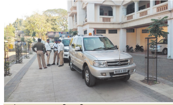
खोडसाळपणा की गंभीर करट

आणि जीवघेणा इशारा या ई-मेलमध्ये देण्यात आला होता. ई-मेल मिळताच जिल्हाधिकारी प्रशासनाने क्षणाचाही विलंब न करता पोलीस अधीक्षकांना तातडीची माहिती दिली. धमकीचे गंभीर लक्षात घेत पोलिसांनी खबरदारीचा उपाय म्हणून संपूर्ण जिल्हाधिकारी कार्यालय तात्काळ रिकामे केले. अधिकारी, कर्मचारी, नागरिकांना इमारतीबाहेर सुरक्षित स्थळी हलवण्यात आले. सध्या जिल्हाधिकारी कार्यालय परिसर पूर्णपणे सील करण्यात आला आहे. वृत्तलिहिलेले तसेच दु.२ वाजेपर्यंत पोलिसांचे सर्च मोहिम सुरु होती. त्यामुळे प्रशासकीय कामकाज मात्र थांबले होते. सर्व अधिकारी व कर्मचारी यांना मुख्य इमारतीच्या बाहेर काढण्यात आले होते. तपासासाठी विशेष पथके तैनात करण्यात आले आहे. घटनास्थळी