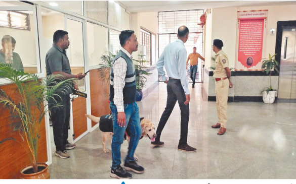
प्रतिनिधी १८ डिसेंबर

प्रशासन, पोलीस यंत्रणा सतर्क - शहरात प्रचंड खळबळ