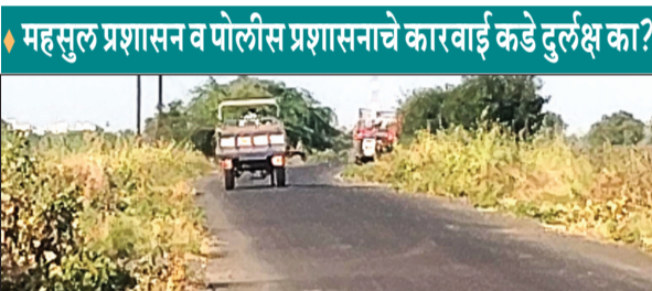
महसुल प्रशासन व पोलीस प्रशासनाचे कारवाई कडे दुर्लक्ष का?

प्रतिनिधी २७ डिसेंबर नसल्याने अवैध रेती वाहतूक करणाऱ्यांना चांगलाच उत आला असून रोज मोठ्या प्रमाणात अवैध रेती वाहतूक व विक्री केली जात आहे. अकोट तालुक्यातील ग्रामीण भागात सर्रास वाहतूक व विक्री होत असून परीसरातील गावात भर रस्यांवर अवैध रेतीचे मोठे मोठे ढिग लागल्याचे दिसून येत आहेत. या कडे अकोट तहसिलदार यांचे दुर्लक्ष होत असून या अवैध रेती वाहतूक व विक्री करणाऱ्यांवर दहीहांडा पोलीसांनी व महसुल प्रशासनाने कारवाई करण्याची मागणी परीसरात जोर धरू लागली आहे.