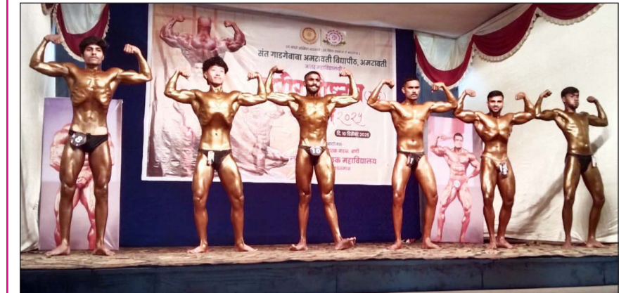
बाँडी बिल्डिंग स्पर्धा : वणी - येथील शिक्षण प्रसारक मंडळ संचालक लोकमान्य टिळक महाविद्यालयाच्या मान्यता असलेल्या संत गाडगेबाबा अमरावती विद्यापीठ आंतरराष्ट्रीय महाविद्यालयीन सौख्य (मुले) २०२५ स्पर्धेचे आयोजन केले आहे. या स्पर्धेत अनेक तरुण बाँडी बिल्डर सहभागी झाले. त्यांनी आपले शारीरिक कौशल्य, ताकद आणि तयारीची झलक प्रेक्षकांसमोर सादर केली. प्रतिस्पर्धीनी विविध पोजेस आणि व्यायामाद्वारे आपल्या कष्टांचे फळ दाखविले, ज्यामुळे स्पर्धेला उत्साहवर्धक वातावरण लाभले. संपूर्ण स्पर्धा रंगतदार व प्रेक्षकांसाठी आकर्षक ठरली.